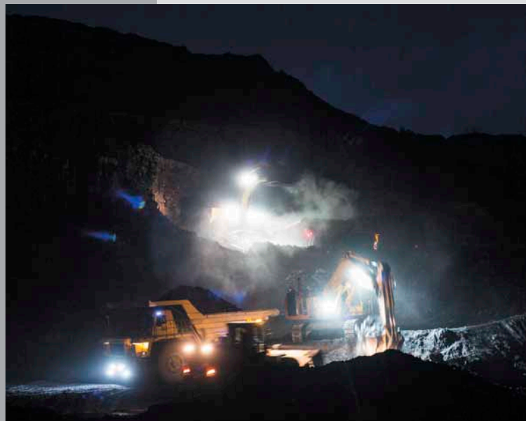
Полночь в разрезе