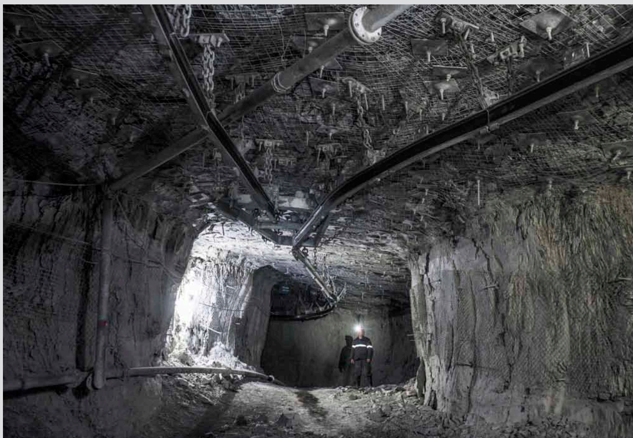
В споре с гравитацией